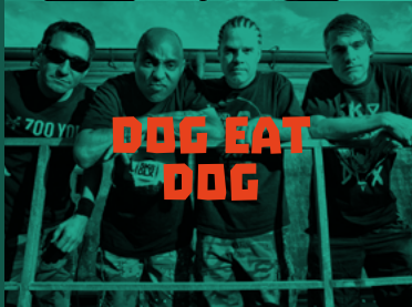
DOG EAT DOG