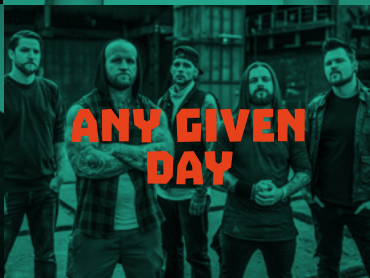
ANY GIVEN DAY